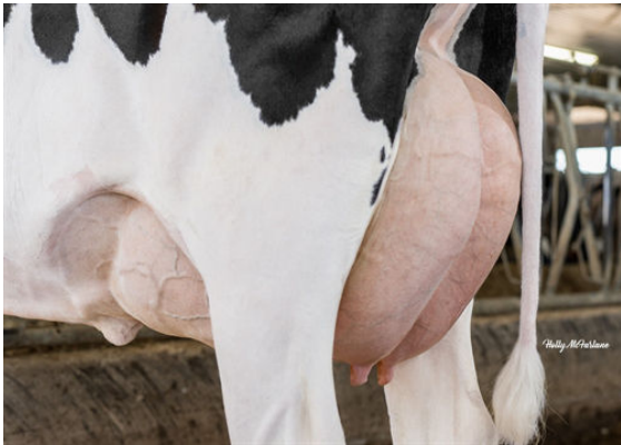
PROGENESIS FABULOUS BRISK DAM