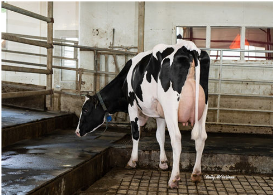
PROGENESIS FABULOUS BRISK DAM